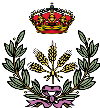
Figura A.1. Logo de la ETSIAAB utilizado en la cubierta trasera de la memoria

La ETSIAAB tiene configurados como colores principal y de link el RGB (99, 178, 76). El logo es el mostrado la figura A.1.