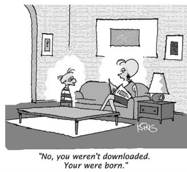
Figura 1 – Uma figura típica

Temos dois exemplos, a figura 1 e a figura 2.