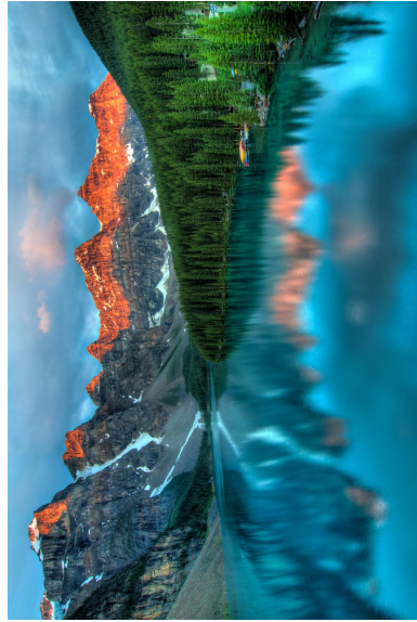
Figure 2: Image 3 Rotated 90 degrees clockwise.

Ut enim ad minima veniam, quis nostrum exercitationem ullam corporis suscipit laboriosam, nisi ut aliquid ex ea commodi consequatur? Quis autem vel eum iure reprehenderit, qui in ea voluptate velit esse, quam nihil molestiae consequatur, vel illum, qui dolorem eum fugiat, quo voluptas nulla pariatur? Nam libero tempore (Figure 2), cum soluta nobis est eligendi optio, cumque nihil impedit,