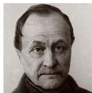
Figura 3: Auguste Comte

A Figura 3 ilustra o uso do comando wrapfigure .