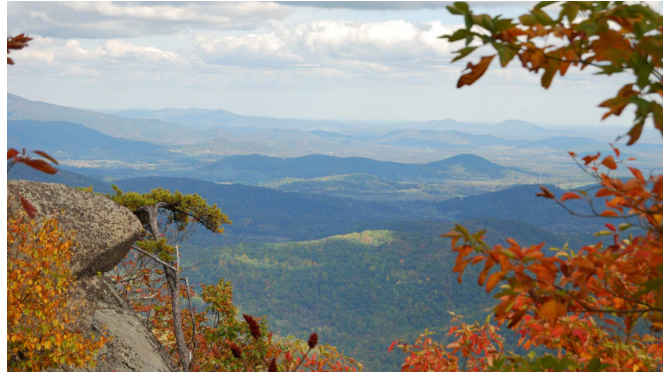
Figure 1. Picture

Quisque ullamcorper placerat ipsum. Cras nibh. Morbi vel justo vitae lacus tincidunt ultrices. Lorem ipsum dolor sit amet, consectetur adipiscing elit. In hac habitasse platea dictumst. Integer tempus convallis augue. Etiam facilisis. Nunc elementum fermentum wisi. Aenean placerat. Ut imperdiet, enim sed gravida sollicitudin, felis odio placerat quam, ac pulvinar elit purus eget enim. Nunc vitae tortor. Proin tempus nibh sit amet nisl. Vivamus quis tortor vitae risus porta vehicula.