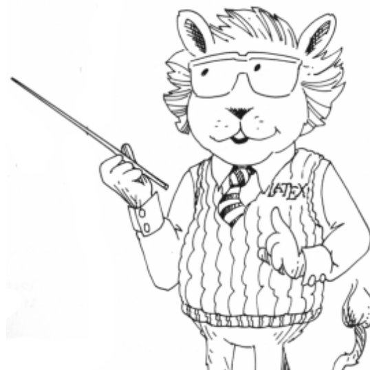
(b) O mascote ensinando