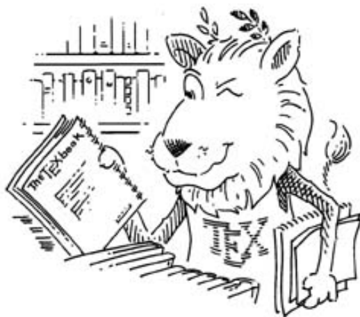
(a) O mascote estudando

Essa é uma subseção da seção 2.1 do Capítulo 2 . Subseções como esta não deverão ser numeradas.